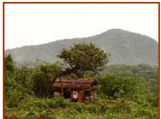
la campagna intorno a Mitunguu

La cooperativa è in grado di ospitare i visitatori , offrendo loro un posto per dormire ed i pasti, spettacoli di musica tradizionale e visite ad alcune fattorie dei dintorni, nella rigogliosa (almeno nella stagione delle piogge) campagna a sud di Meru. Trascorrere qualche giorno in questo luogo è forse il miglior modo per aiutare la cooperativa, oltre ovviamente a provare i prodotti che sono disponibili in qualunque negozio del Commercio Equo e Solidale in Italia.